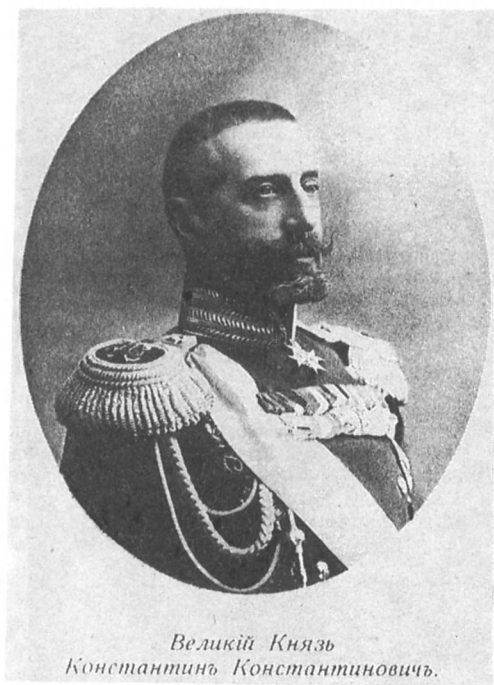
Великий Князь Константинъ Константиновичъ.

Великий князь Константин Константинович (1858—1915) родился в семье великого князя Константина Николаевича и великой княгини Александры Иосифовны, был внуком императора Николая I. Отец возглавлял морское ведомство России и с детства готовил сына к морской военной службе. Уже с 12 лет Константин Константинович проводил каждое лето на судах учебной эскадры Морского училища. Морские путешествия увлекали великого князя всю жизнь, давая пищу для лирических стихотворений.