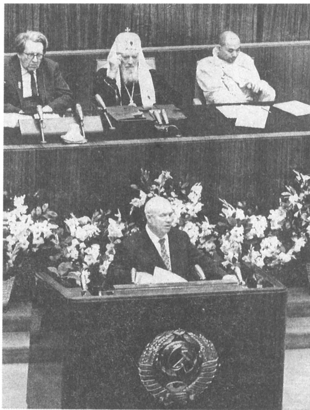
В президиуме Всемирного конгресса за всеобщее разоружение и мир. Выступает Н. С. Хрущев. Москва. 10 июля 1962 г. № 1—314384.

времени, может быть истолкована как косвенная критика нового постановления правительства. У меня сложилось впечатление, что патриарх, подчеркивая положительное отношение к ленинскому законодательству, в то же время довольно тонко пытался показать, что, вот, дескать, теперь местные работники и государство действуют по-иному, проводят другую линию, закрывают церкви.