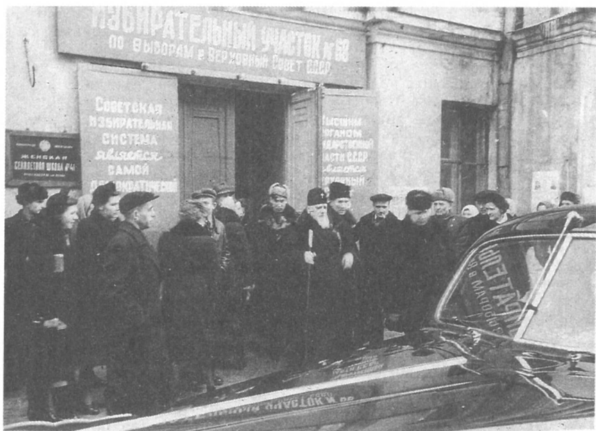
На избирательном участке № 68 г. Москвы в день выборов в Верховный Совет СССР. Москва. 1950 г. № 0—309646.

совет будет вести разговоры с правительством Литовской и Латвийской республик».