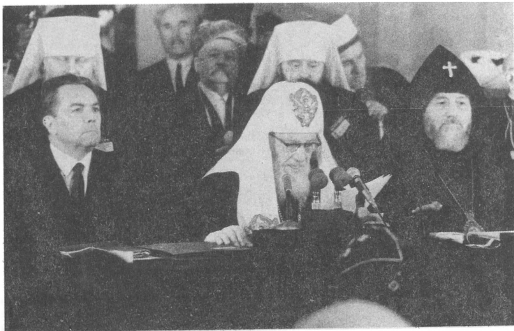
В. А. Куроедов и патриарх Алексий на конференции представителей всех религий СССР. Троице-Сергиева лавра. Май 1967 г. К/д № 1—25041.