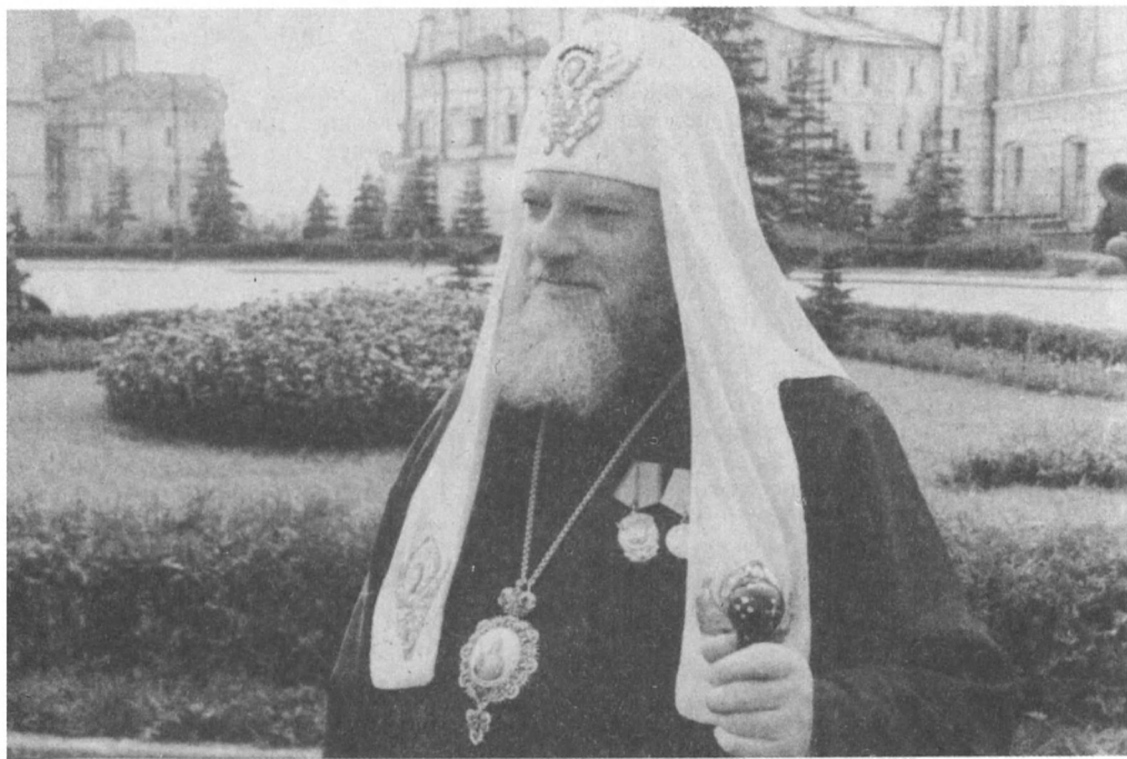
На территории Московского Кремля после вручения ордена. Москва. 1946. г. К/д № 1—6451.

«Конечно,— сказал патриарх,— письма все, которые просил Никита Сергеевич, мы пришлем в совет, но адресуем на имя тов. Хрущева, как он просил. Тем более, Никита Сергеевич сказал, что все вопросы он рассмотрит в правительстве в самое ближайшее время. Конкретно мне трудно указать, м[итрополит] Николай, правда, называет Коломну, Ногинск, но я затрудняюсь сказать».