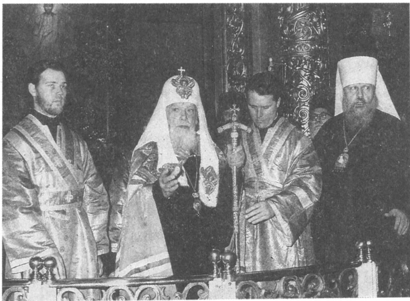
Во время Рождественского богослужения в Богоявленском патриаршем кафедральном соборе. Справа: митрополит Крутицкий и Коломенский Пимен. Москва. 8 января 1970 г. Фото Б. Трепетова. № 0—314175.

К тому же нужно еще отметить, что у дверей собора оказались толпы верующих за приобретением свечей, с которыми по богослужебному уставу по-